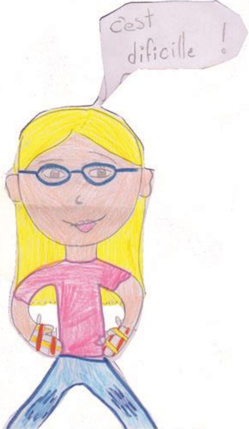
dessin de Myka, école Pie XII