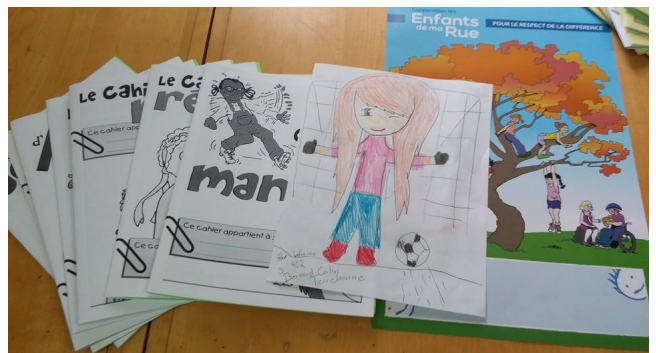
Félix Lafrance 4ième année de l'école Bernard-Corbin